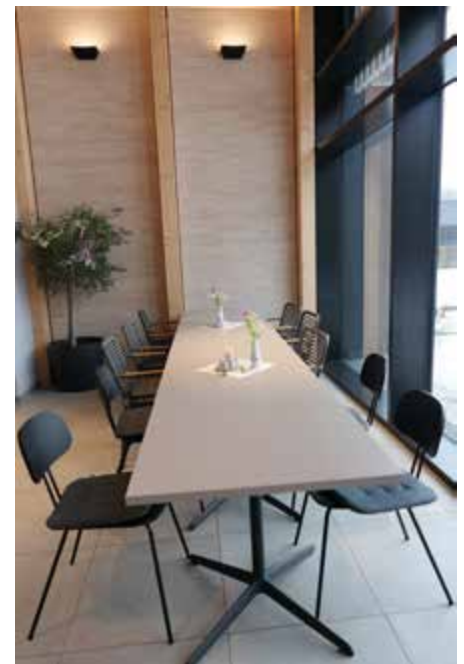
Für größere Gruppen: ein länglicher Business-Tisch an der rückwärtigen Giebelseite.