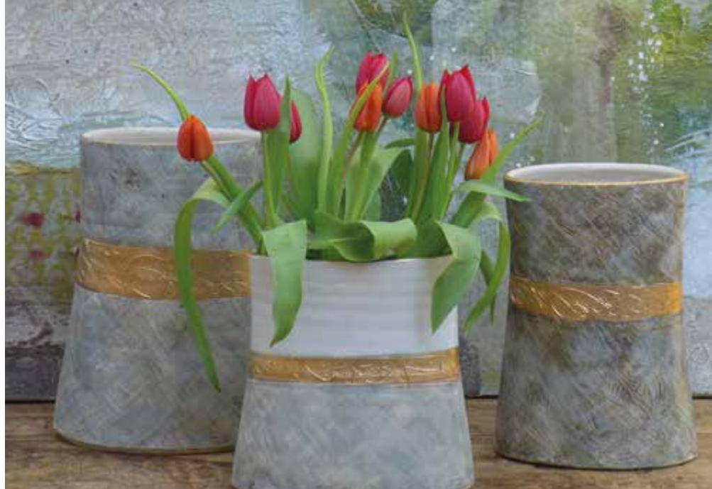
Vasen aus Hollfeld: die Tonflächen bleiben ruhig, Akzente setzt die feine Goldauflage