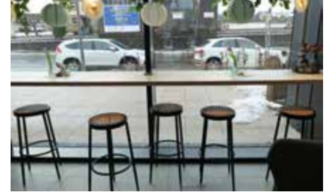
Nichts verpassen: an der Glasfront kann man auch Stehsitze wählen und wunderbar 'rausgucken.