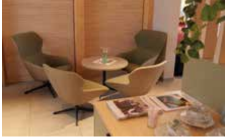
Wie daheim im Wohnzimmer: großzügig sitzen ist im Pittersdorfer Café kein Problem.